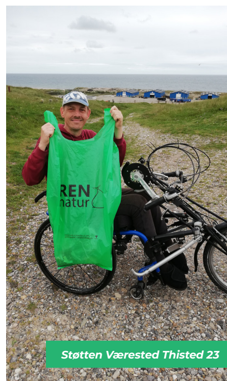
Støtten Værested Thisted 23