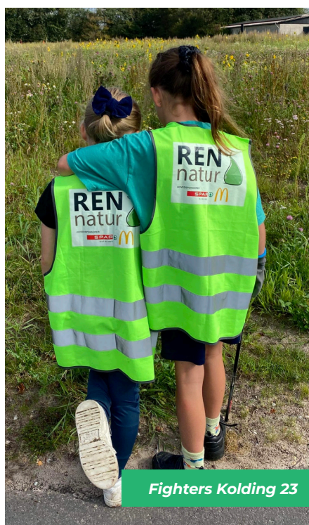
Fighters Kolding 23