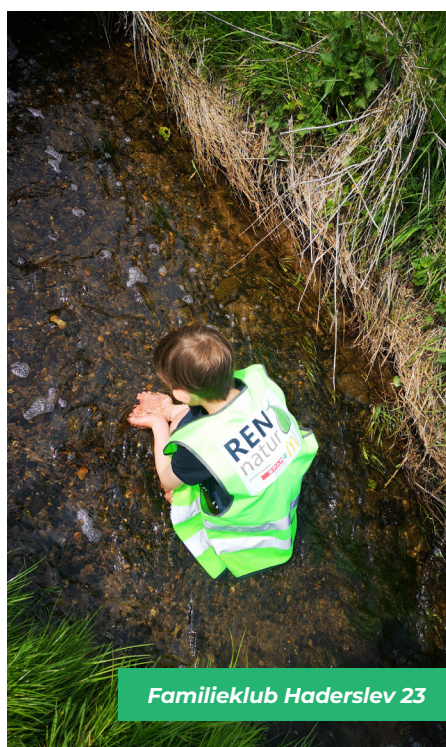
Familieklub Haderslev 23

Det er også her der skal lyde et stort TAK til Ølgod Efterskole, som donerede deres indsamlede midler indtjent ved den årlige 100 km gåtur rundt om Ringkøbing Fjord i 2022. Deres donation er anvendt netop til denne gruppe og vi er overbevist om, at det glæder alle elever og deres forældre at høre hvilken forskel, de har været med til at gøre.